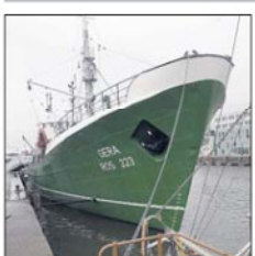
Das Museumsschiff „Gera“ liegt im Schaufenster Fischereihafen.

Das einzige deutsche schwimmende Hochseefischerei-Museum liegt im Schaufenster Fischereihafen. Die Besucher der „Gera“ erfahren, wie die Seeläute lebten und arbeiteten. Es ist