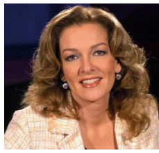
Bettina Tietjen TV-Moderatorin