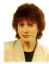
Olga Bondarenko Olympiasiegerin 10.000 m d. Frauen