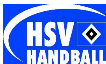
HSV-Handballmannschaft mit drei Weltmeistern